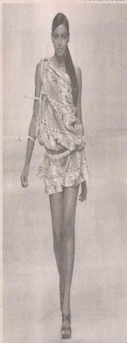
■ NO ÚLTIMO DIA, PASSARELA RECEBEU ESTILISTAS DE RENOME E PROFISSIONAIS LOCAIS DE MUITA CATEGORIA